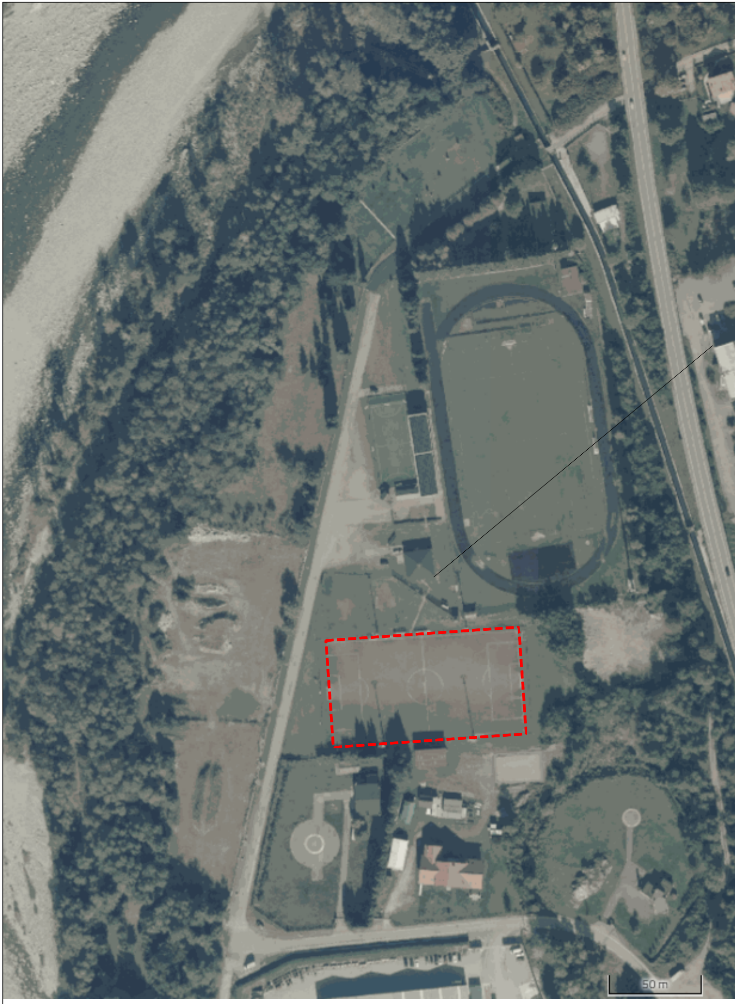
F-08 ORTOFOTO 1:2000