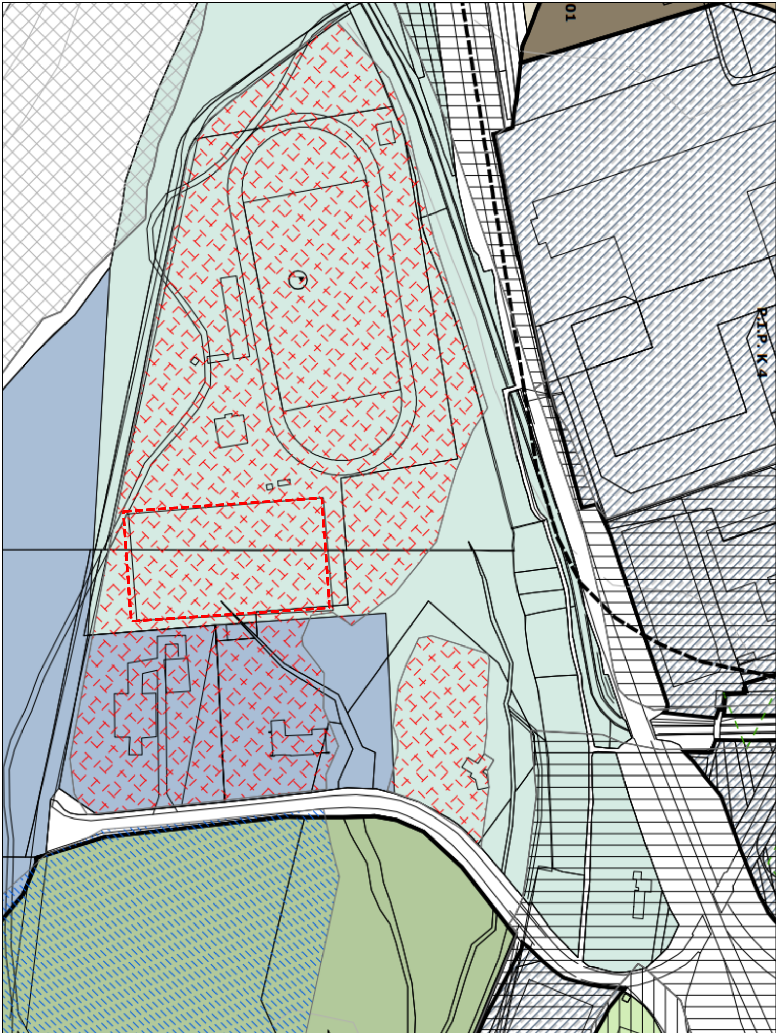
ESTRATTO PRG - Tavola D 3.2 1:2000